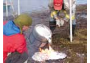
公開制作の様子 (2014年11月29日、美術館前)